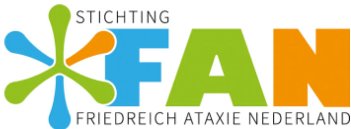
Figuur 1 Het logo van Stichting-FAN.

Voor 2022 staat onder andere op de agenda: de organisatie van een tweede evenement, het vaststellen van criteria om financiële bijdragen vanuit de Stichting-FAN te beoordelen, uitbreiden van het netwerk en op welke wijze ons te positioneren in het wereldwijde veld van FA onderzoek waar wij mogelijk een financiële bijdrage in kunnen leveren.